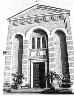
Comunità cristiana di Celesio 2019-20 ☽ “Nella gioia del Battesimo”