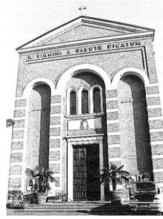
Comunità cristiana di Celesio 2019-20 ☞ “Nella gioia del Battesimo”