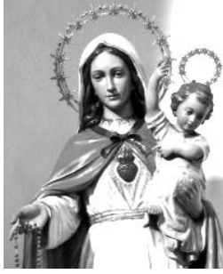
Chiesa della Presentazione della B. V. Maria