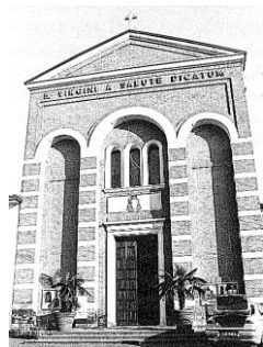
Comunità cristiana di Celesio 2019-20 ☽ “Nella gioia del Battesimo”